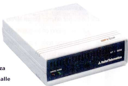
La NT-1 che Telecom piazza per accedere alle linee ISDN

nuovo prodotto -come gli adattatori DataVoice e ExpresSO della di Scii (la prima è una scheda attiva PCI o NuBus, la seconda invece è una PCI passiva)-, si preoccupa di fornire il supporto per un protocollo diffuso come il LeoPro e magari di sviluppare un programma, è il caso di TransFile 5.0, che estenda la compatibilità diretta con altri client già utilizzati in molti ambienti, con i nuovi standard in procinto di uniformazione come l'EuroFile, e con Windows 95 per quanto riguarda i collegamenti tra piattaforme diverse. TransFile è in italiano e permette di trasferire file affasciando sino a 4 canali. Il problema di standard non univoci rimane alla base delle parziali incomprensioni tra schede di diverse case produttrici e i differenti software di trasferimento file.